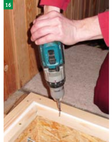
16 spojení OSB rámu s dřevěným rámem