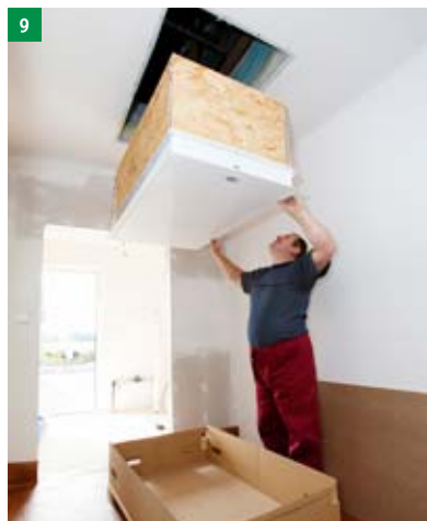
9 jedna osoba v horním podlaží pomocí zvedacího zařízení schody vyzvedne do otvoru a druhá osoba je zespodu přidržuje a kontroluje dosednutí do otvoru