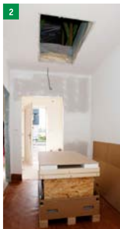
2 rozbalení stahovacích schodů ARISTO