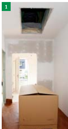
1 dodaný výrobek

1 поставленное изделие 2 распаковка складной лестницы «ARISTO» 3 снятие верхнего люка 4 проверка комплектности поставки 5 установка стропильных проушин 6 крепление подъемного оборудования – грузоподъемность 150 кг (не является составной частью поставки) 7 перемещение монтажных деталей на этаж 8 установка фиксирующих болтов в плоские крепления 9 один человек на верхнем этаже при помощи подъемного оборудования подымет лестницу в отверстие, второй человек их снизу придерживает, направляет в отверстие и контролирует усадку в отверстии 10 демонтаж фиксирующих болтов из креплений 11 монтаж швеллеров 12 демонтаж стропильных проушин и заглушка возникших отверстий заглушками 13 запенивание щели между лестницей и строительным проемом монтажной противопожарной пеной (пена не является составной частью поставки) 14 установка утепляющего обрамления 15 установка деревянной рамы (ВНИМАНИЕ, петли на раме должны быть расположены на противоположной стороне скобы крепления пружин) 16 соединение ОСП рамы с деревянной рамой 17 соединение тяг открытия с верхним люком 18 монтаж верхних перил 19 регулировка открывания нижнего люка при помощи регулировочных болтов (верхняя плоскость настила должна быть параллельна с полом) 20 регулировка на высоту при помощи ножек 21 при складывании лестницы одной рукой придерживаем люк, а второй рукой складываем лестницу 22 лестницы задвинем в люк 23 вторая сторона опускающей штанги оборудована пластиковым наконечником, которым люк закрывается