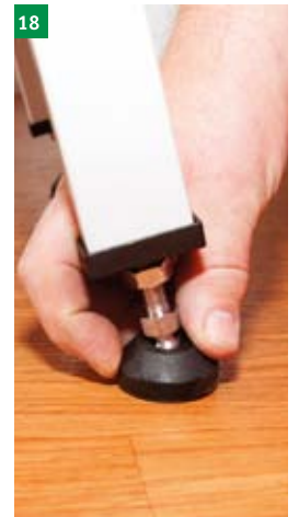
18 výšková regulace pomocí nožiček