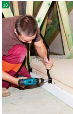
18 montáž horního zábradlí