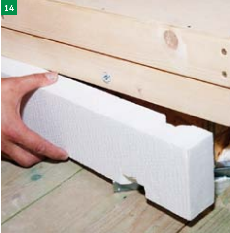
14 osazení zateplovacího límce