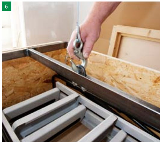
6 uchytení zvedacího zařízení – nosnost 150kg (není součástí dodávky)