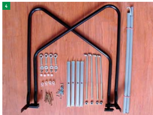
4 kontrola úplnosti dodávky