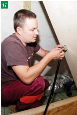
17 spojení táhel otvírání s horním víkem