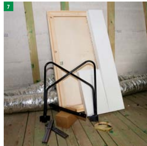
7 přemístění montážních dílů do patra