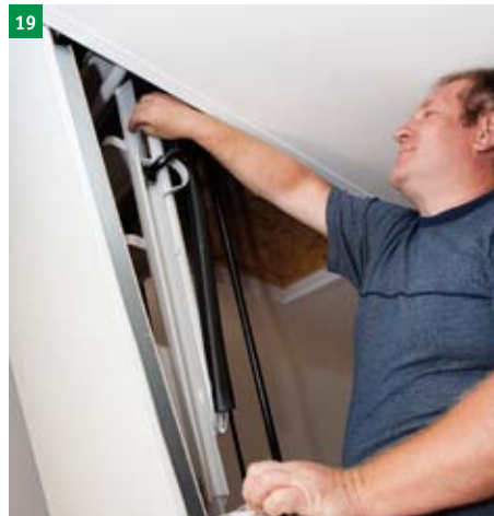
19 upravení otvírání dolního víka pomocí regulačních šroubů (horní plocha nášlapů musí být rovnoběžně s podlahou)