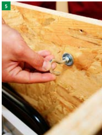
5 nasazení závěsných ok