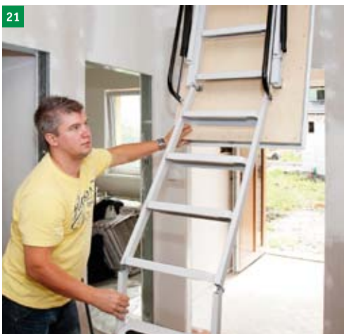
21 při skládání schodů jednou rukou přidržíme víko a druhou rukou skládáme schody