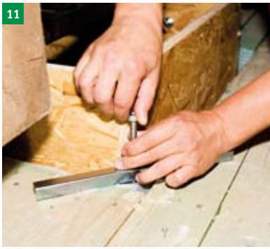
11 montáž nosníků