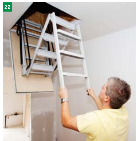
22 schody zasuneme do víka