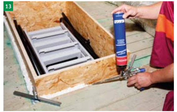
13 vypěnění mezery mezi schodištěm a stavebním otvorem montážní protipožární pěnou (pěna není součástí dodávky)