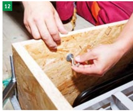
12 demontáž závěsných ok a zasazení vzniklých otvorů zásepky