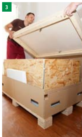
3 sundání horního víka