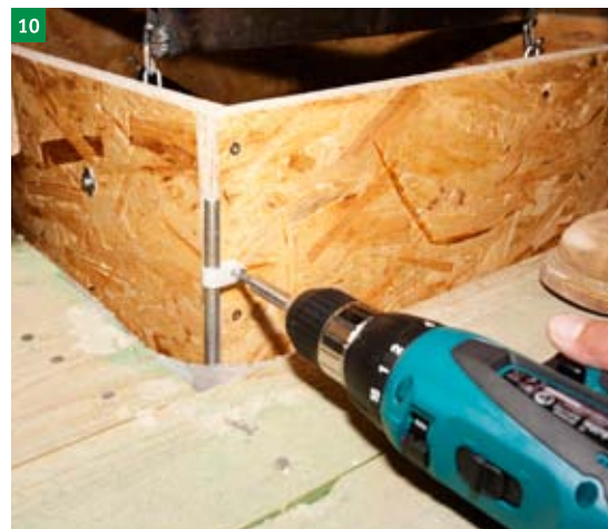
10 demontáž kotevních šroubů z úchyť