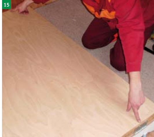
15 nasazení dřevěného rámu (POZOR panty na rámu musí být na protilehlé straně třmenu uchycení pružin)