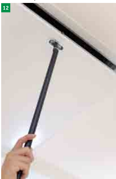
12 nasazení stahovací tyče a otevření víka