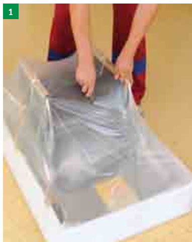
1 rozbalení stahovacích schodů