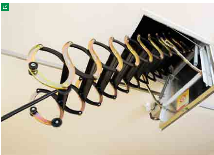
15 složení schodů pomocí stahovací tyče