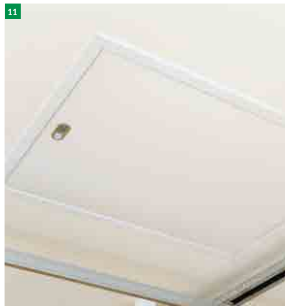
11 vsazené a utažené stahovací schody ve stropním otvoru