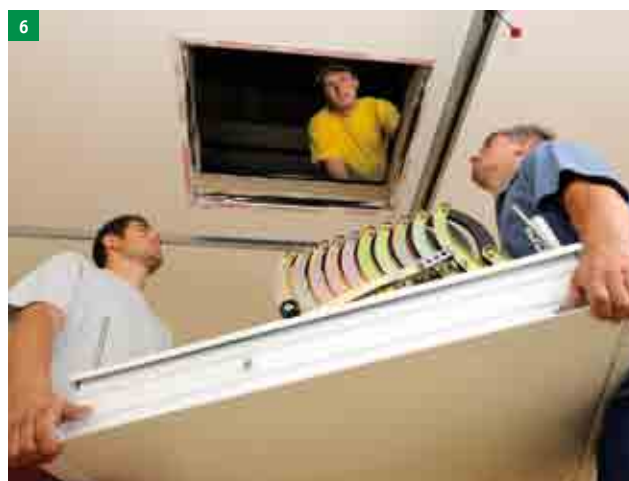
6 dvě osoby vyzvednou schody do stavebního otvoru