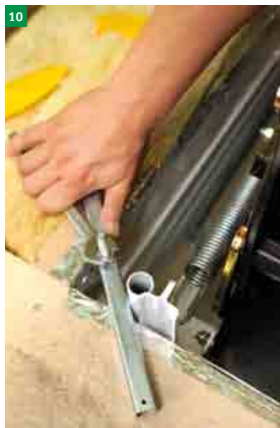
10 řádné utažení 4 ks kotevních šroubů