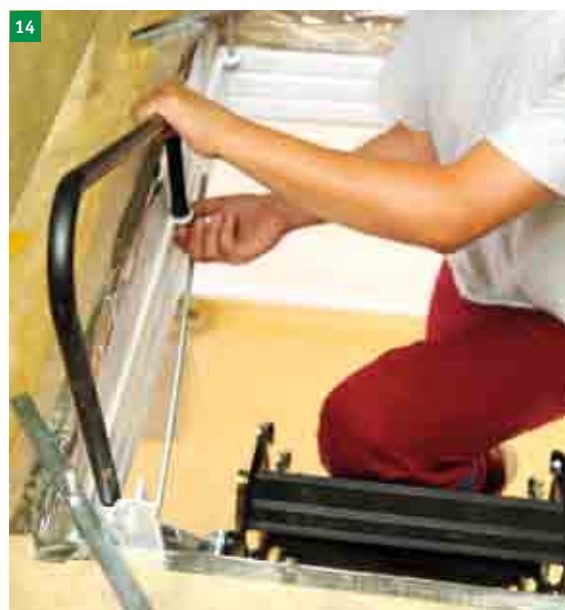
14 nasazení a přišroubování madla na rám schodů