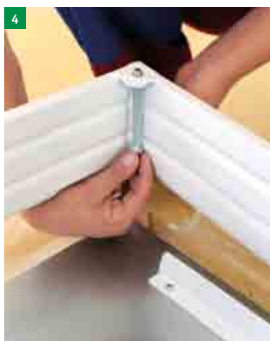
4 nasazení 4 kotevnicích šroubů