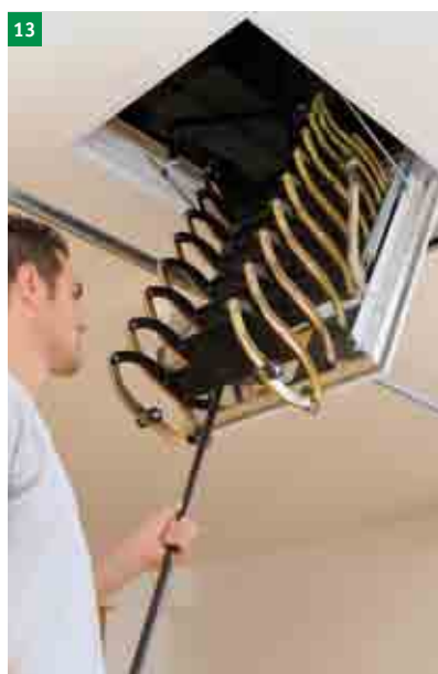
13 stažení schodů pomocí stahovací tyče