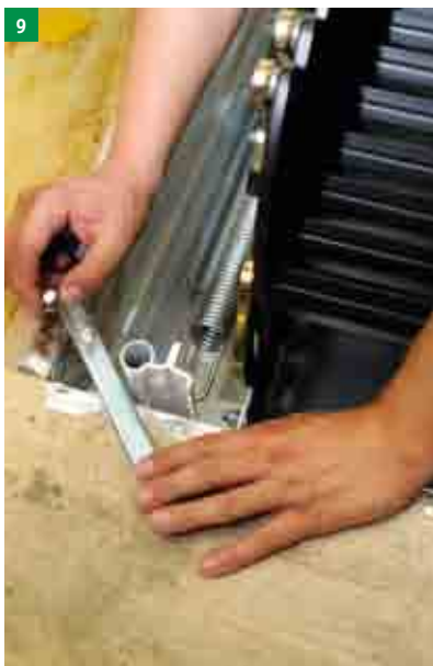
9 třetí osoba, která je již v půdním prostoru pomocí 4 ks nosníků upevní rám