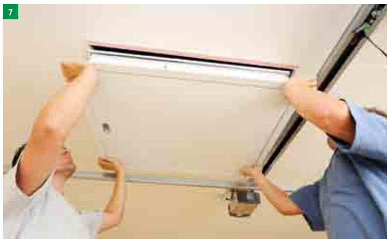
7 vsazení schodů do stavebního otvoru